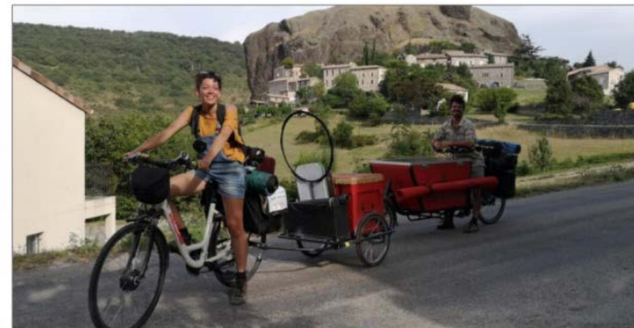
Après la représentation, la caravane a repris la route vers de nouveaux horizons.

La soirée, offerte par les responsables du centre communal d'action sociale, s'est poursuivie par des échanges chaleureux autour du verre de l'amitié.