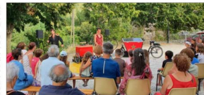
Les artistes devant leur public ravi, vendredi 23 juillet.